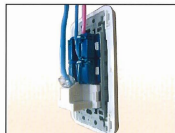
情報コンセント背面