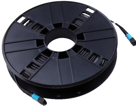
Full Fiber Cable