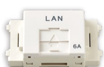
CW(セラミックホワイト)